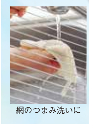
網のつまみ洗いに

ロングバイルタイプ バイルが長く、やや厚手。スタンダードタイプよりクッション性のある一枚。 生地アップ