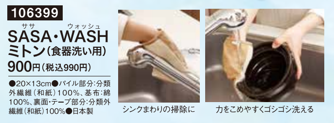
シンクまわりの掃除に 力をこめやすくコシゴシ洗える

ミントンタイプ 手のひら全体でギュキュッと洗えるので、力を入れて洗いたいものにぴったり。 生地アップ